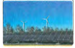
( أ )

١٦ يعتبر تدريب المزارعين على استخدام الأساليب الحديثة في الزراعة من اهتمامات مجال التنمية ..... ( أ ) البيئية والبشرية . ( ب ) البشرية والاقتصادية . ( ج ) الفردية والبشرية . ( د ) الاقتصادية والبيئية .